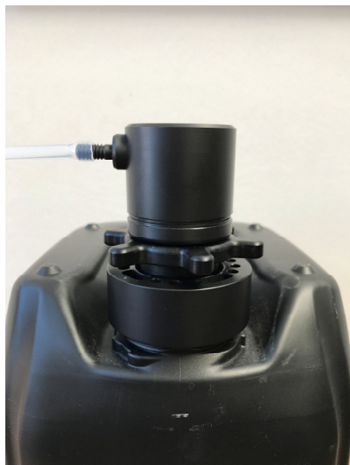
Entnahme aus einem 30 l Kanister mit der M2 Serie