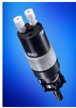
RDP-89700 Fassungspumpe leitfähig RDP-89699 Fassungspumpe Standard